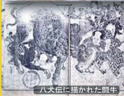
八犬伝に描かれた闘牛